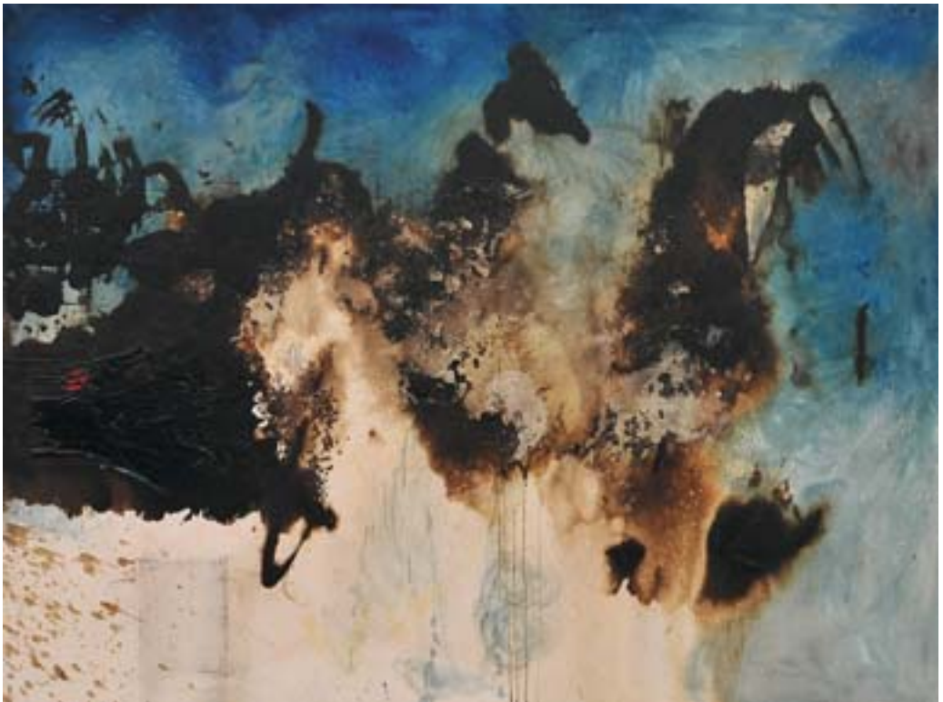
Pejzaż błękitny II, olej, płótno, 200x160, 2009