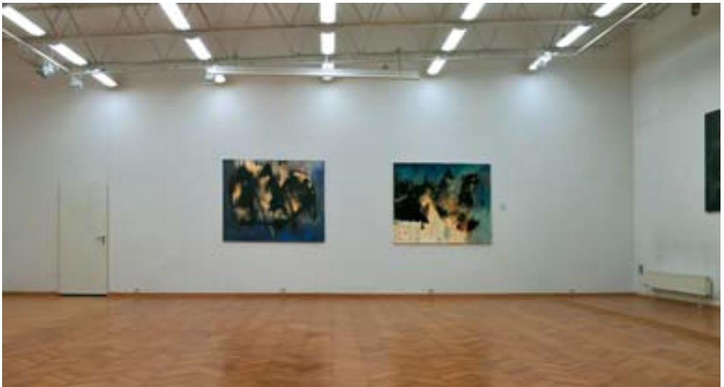
Malarstwo, Andrzej Bembenek, Galeria BWA Zielona Góra, 2010