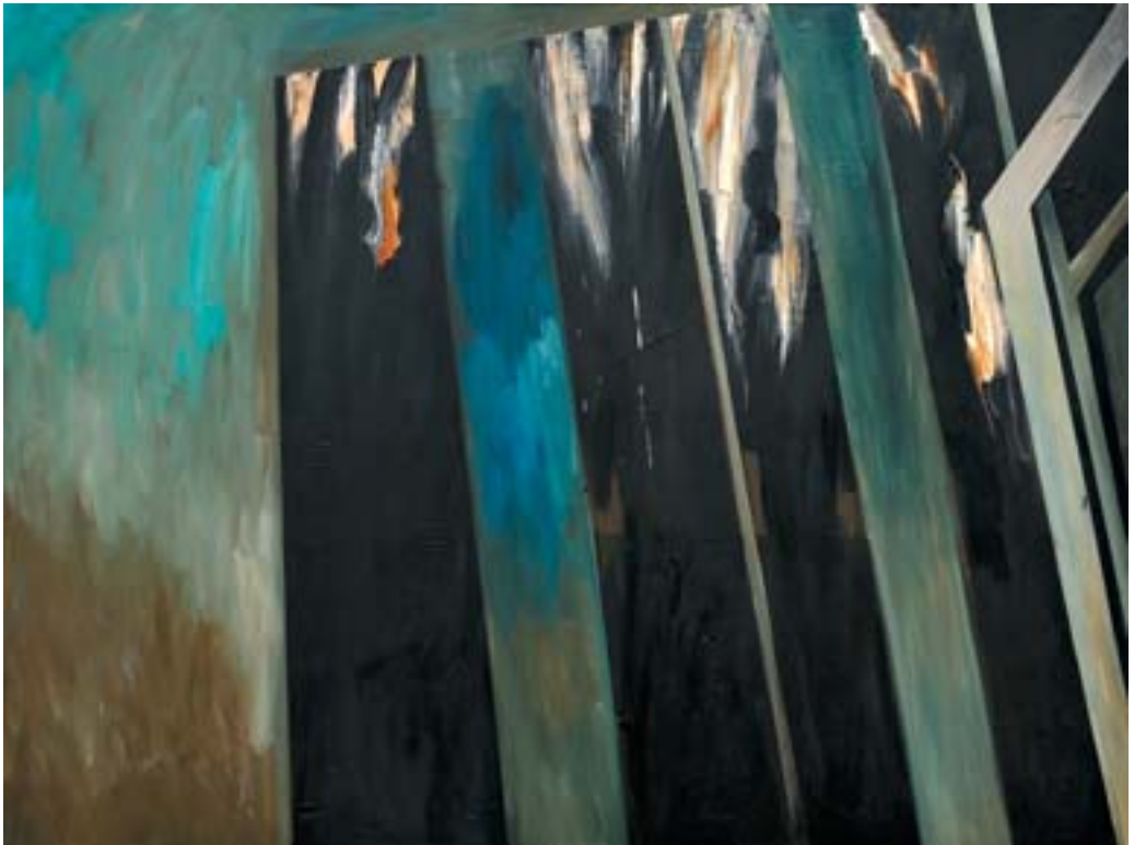
Pejzaż II, olej, 200x150, 2009