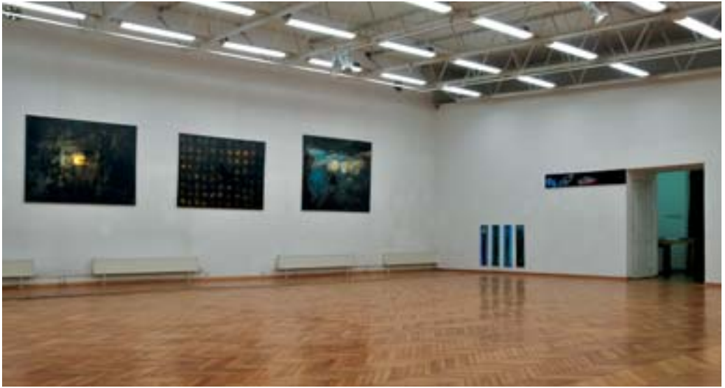
Malarstwo, Andrzej Bembenek, Galeria BWA Zielona Góra, 2010