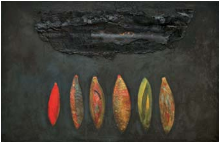
Martwe morze , olej, płótno, papa, 200x150, 2007