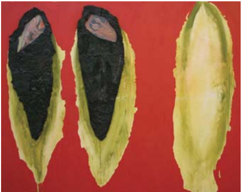
Śpiące ryby , olej, płótno, papa, 200x160, 2007