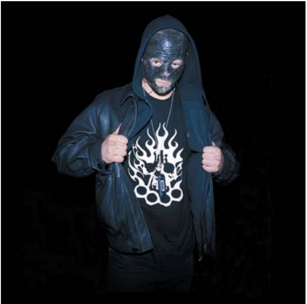
Hassmonster , 2008, C-Print auf Alu-Dibond hinter Acrylglas, Maße: 100 x 100 cm