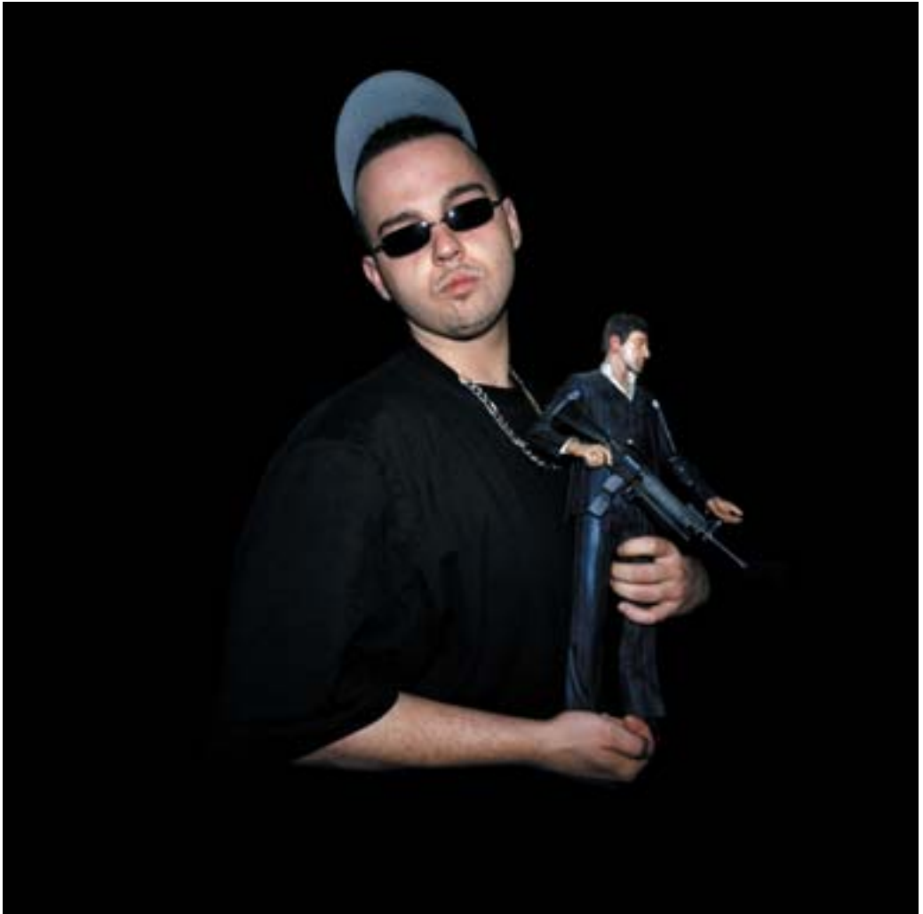
Babu und Al , 2008, C-Print auf Alu-Dibond hinter Acrylglas, Maße: 100 x 100 cm